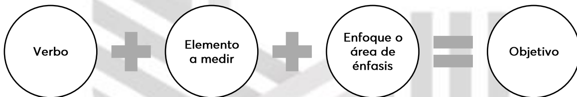
Figura 1. Estructura base para la redacción de los objetivos del PED, Campeche.

Para la redacción de un objetivo es necesario definir el propósito de este, el estado esperado o el producto final que se pretende alcanzar; además, se debe de indicar el elemento a medir, así como el área de enfoque. Para la definición de los objetivos, es necesario identificar la idea principal o logro, así como que su progreso pueda ser medido u observado.