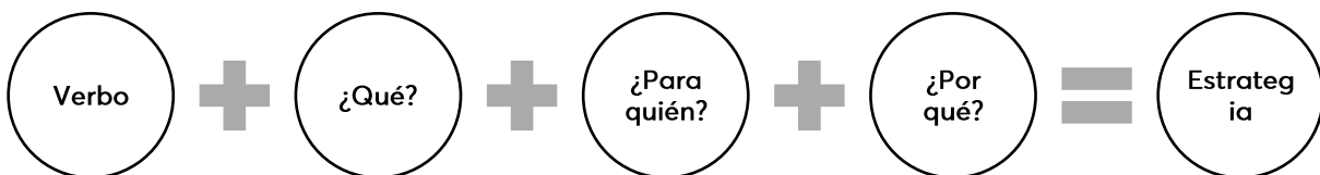
Figura 2. Estructura base para la redacción de las estrategias del PED, Campeche.

Ejemplo: Otorgar apoyos a las personas adultas mayores para mejorar las condiciones de vida y que a su vez permita el acceso a la protección social.